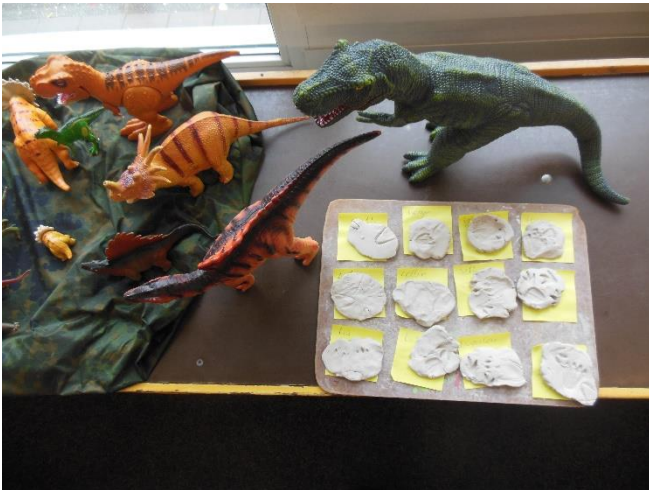
Groep 1-2C maakte voetafdrukken van dino's

Kinderboekenweek van 30-9 t/m 11-10. Thema: en toen?