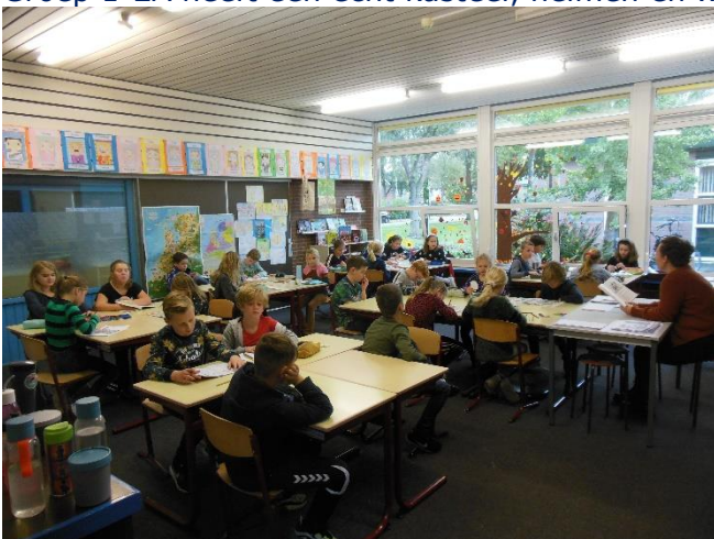
Groep 6 wordt extra voorgelezen.

Meld uw kind aan voor blok 2 van Muzieklessen bij de BSO!