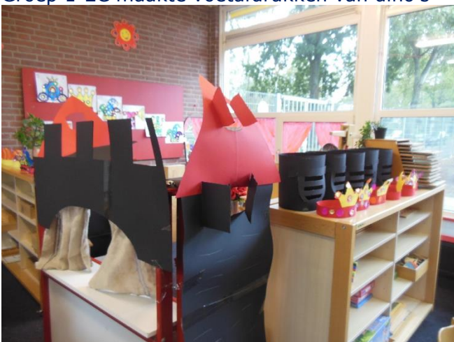
Groep 1-2A heeft een echt kasteel, helmen en ..