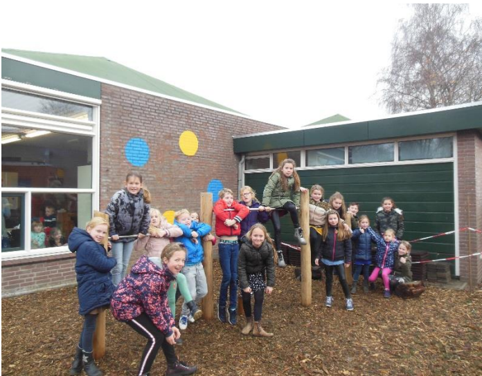
Dit duikelrek staat bij de ingang van groep 3