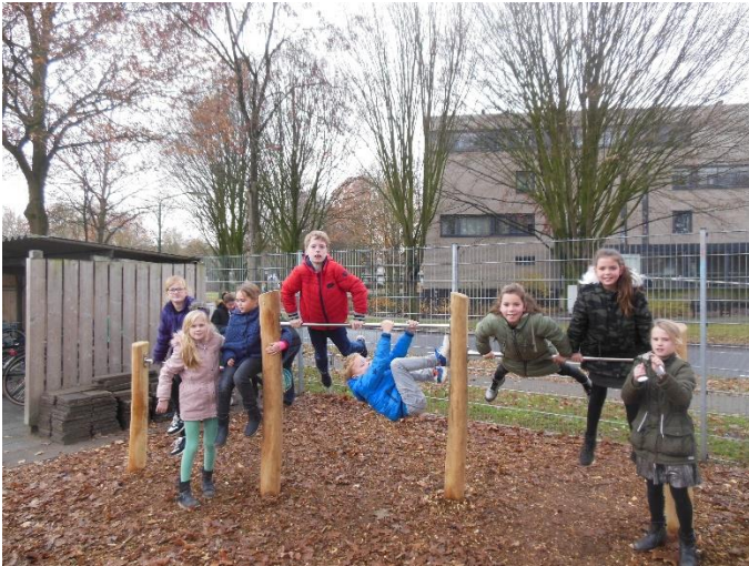
Dit duikelrek staat naast de fietsenstalling!